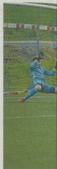
Der entscheidende Moment.