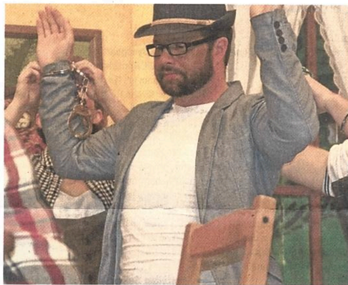
Das seltsame Duo wandert hinter Schloss und Riegel.