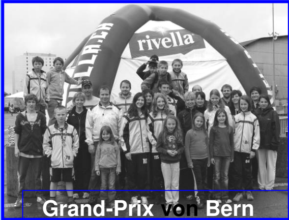
Grand-Prix von Bern

Zusätzlich hatten wir die Bevölkerung von Arboldswil + Titterten eingeladen mit uns zu kommen.