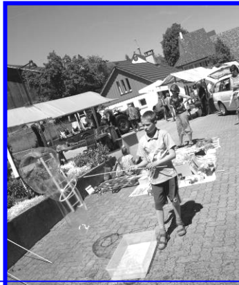
Anti Stau Markt

Zusätzlich hatten wir die Bevölkerung von Arboldswil + Titterten eingeladen mit uns zu kommen.