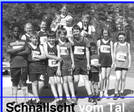
Schnallscht vom Tal

Einen festen Platz hat dieser Sprintwettbewerb in unserem Jahresprogramm. Wir erreichten in diesem Jahr sensationelle 10 Podestplätze.